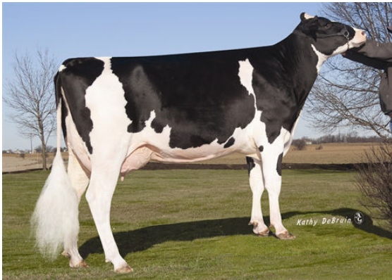
PLAYBALL MNOM BOUNTY THIRD DAM