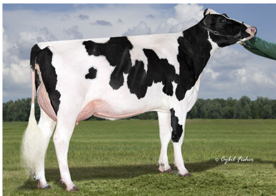
SIEMERS GRT PARINI 28262 DAM