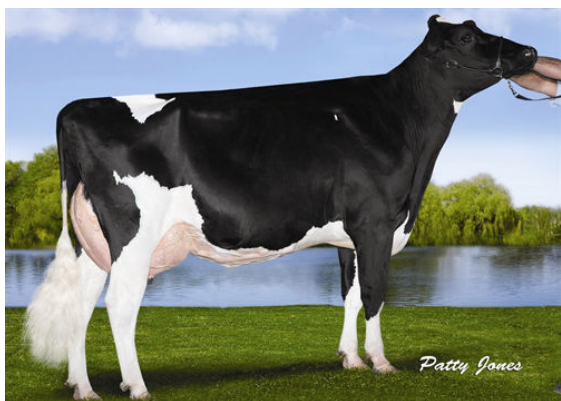
RANSOM-RAIL FACEBK PARIS FOURTH DAM