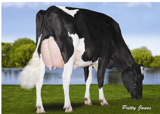
RANSOM-RAIL FACEBK PARIS FOURTH DAM