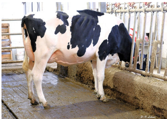
LEHOUX STARS FUNKY DAUGHTER