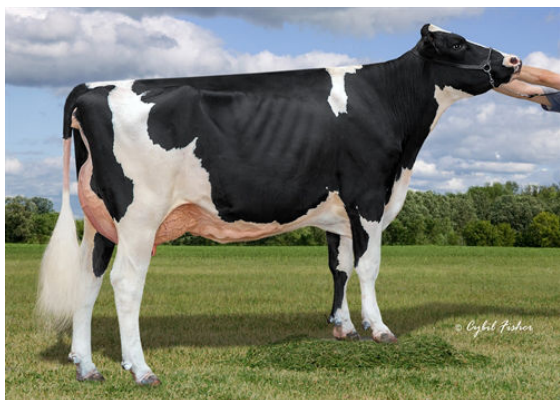
AOT POSITIVE HALLMARK