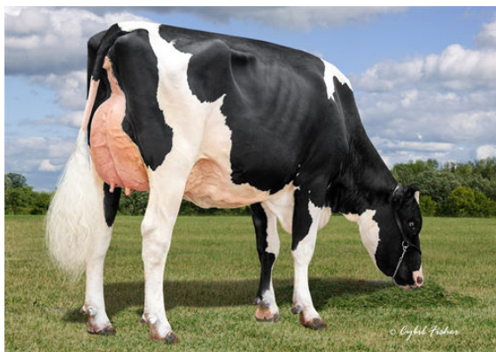
AOT POSITIVE HALLMARK