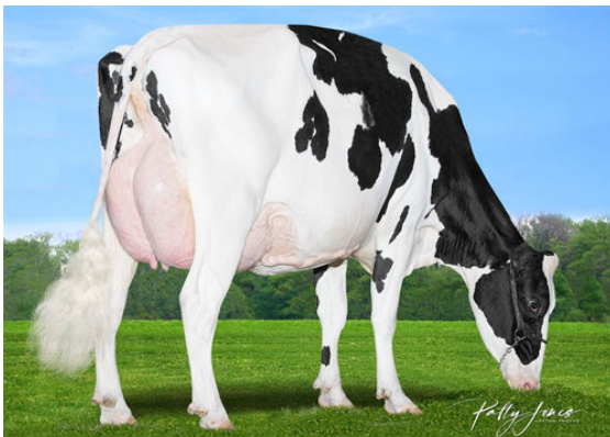
MORNINGVIEW DUKE ZIP GRANDDAM