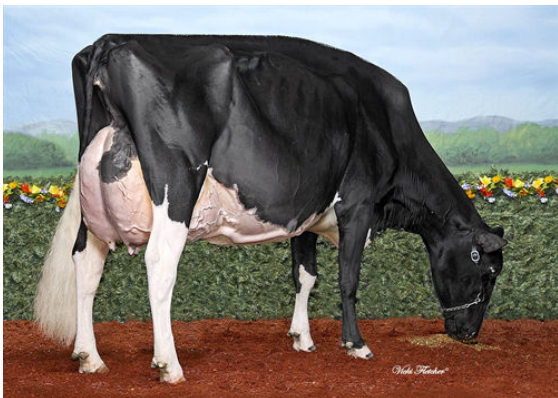
COMESTAR LAMADONA DOORMAN GRANDDAM