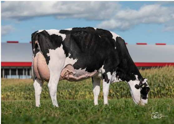
COMESTAR LAMAGIC IMPRESSION DAM