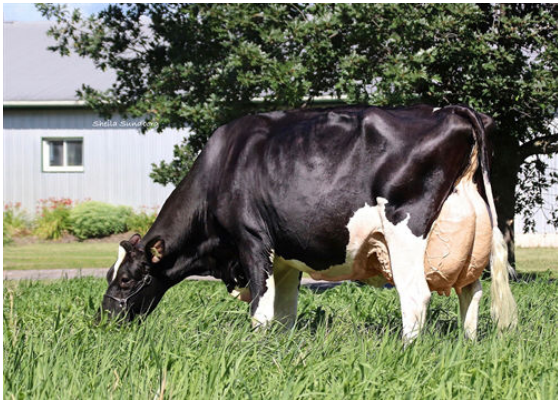
MYSTIQUE EXTREME ABRICOT GRANDDAM