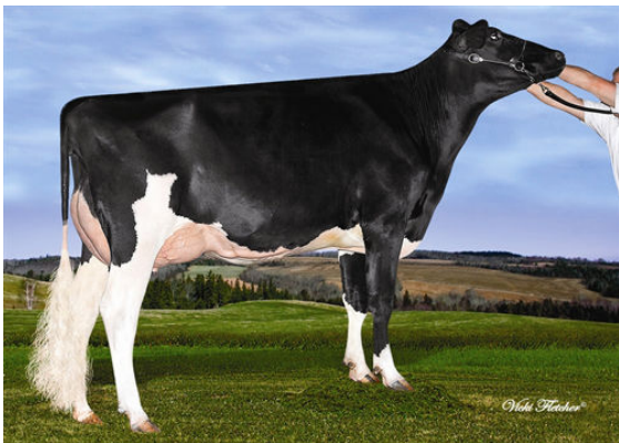
LINDENRIGHT BRADNICK MOOVIN ON THIRD DAM