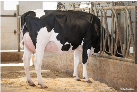
PROGENESIS GRAZIANO JAZMATIC DAM