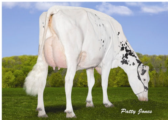
VELTHUIS S G SNOW EVENING FIFTH DAM