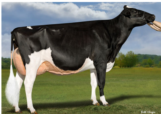
S-S-I DOC HAVE NOT 8784 FULL SISTER TO GRANDDAM