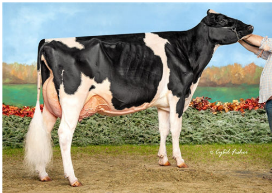
S-S-I DOC HAVE NOT 8783 GRANDDAM