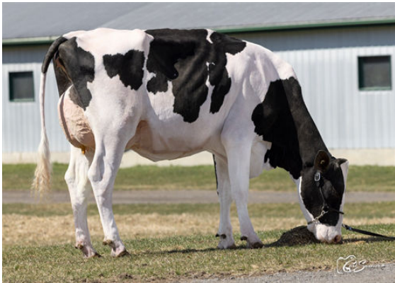
MYSTIQUE RANGER ARANCINI DAM