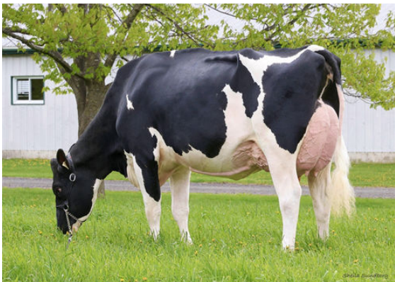
MYSTIQUE ROZUME ANICET GRANDDAM