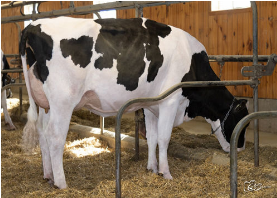
MYSTIQUE RANGER ARANCINI DAM