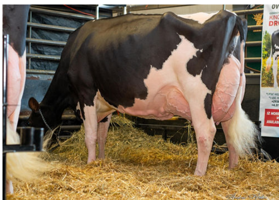
KINGS-RANSOM CASP DAZE GRANDDAM