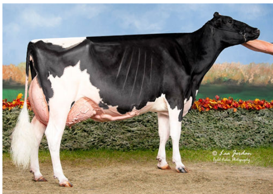
KINGS-RANSOM CASP DAZE GRANDDAM