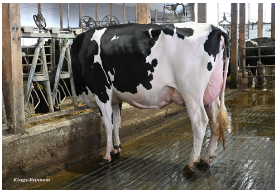
KINGS-RANSOM HAPPN DABBY DAM