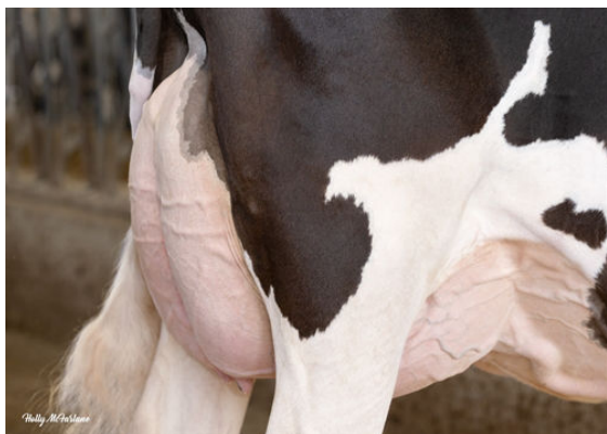
PROGENESIS GAMEDAY SIGNAL