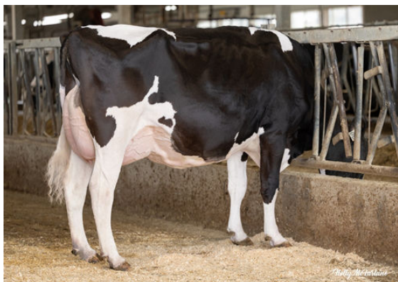
PROGENESIS GAMEDAY SIGNAL