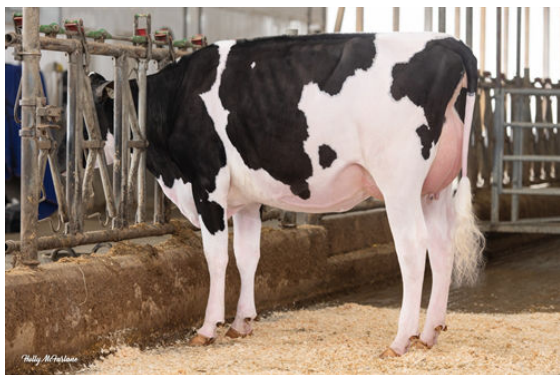
WALNUTLAWN BULLSEYE SADIE