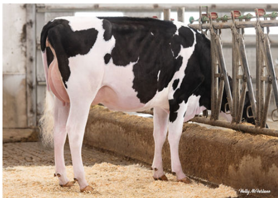
WALNUTLAWN BULLSEYE SADIE