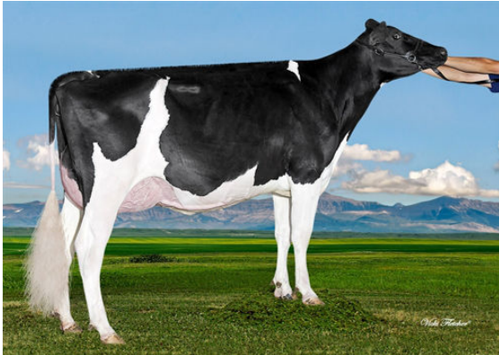
BGP MODESTY IMOGENE GRANDDAM