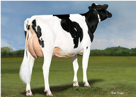
REGAN-DANHOF JEDI CASHMERE DAM