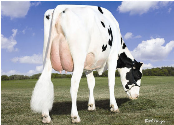
AMMON-PEACHEY SHANA FIFTH DAM