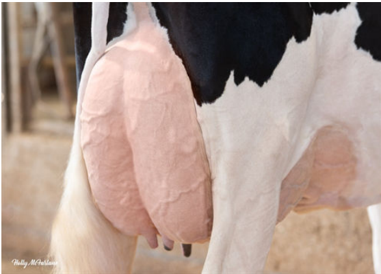
PROGENESIS HIGHJUMP LEADER DAM