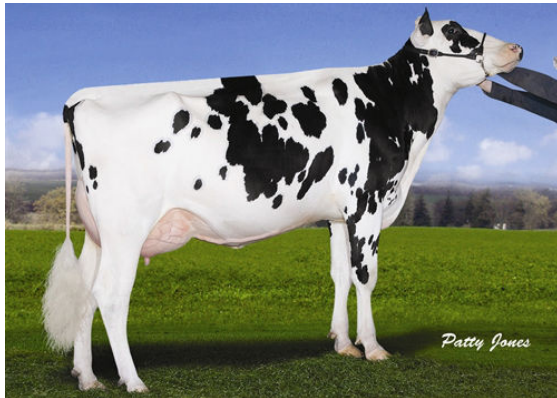
GILLETTE BOLTON 2ND LOOK FIFTH DAM