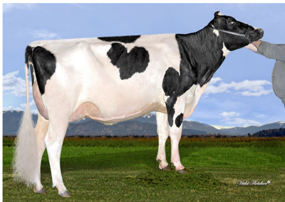
WESTCOAST POPSTR SIL6827 8977 DAUGHTER