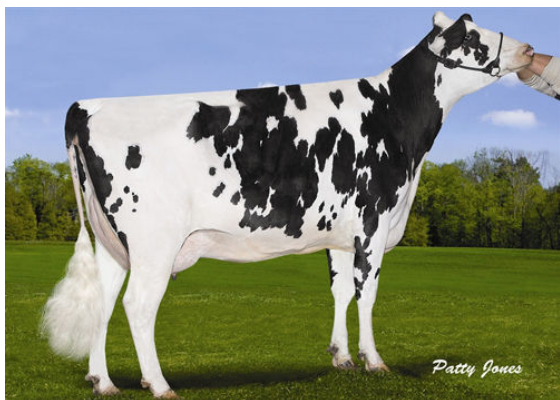
STANTONS SUPER ELDA FOURTH DAM