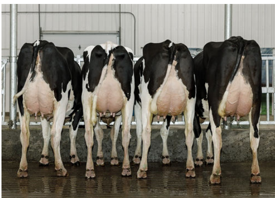
DROPBOX DAUGHTER GROUP

L TO R - GENOSOURCE DROPBOX 77385, GENOSOURCE FOLP 14893, GENOSOURCE DROPBOX 77610, GENOSOURCE DROPBOX 77414