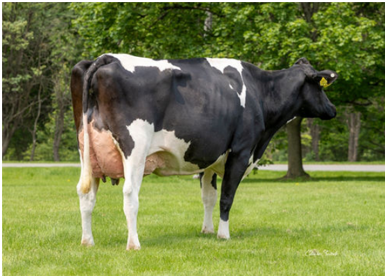
AURORA PERFECT 23719 DAM