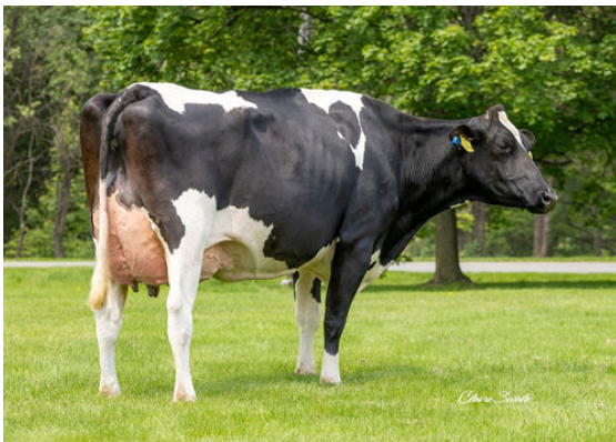
AURORA PERFECT 23719 DAM