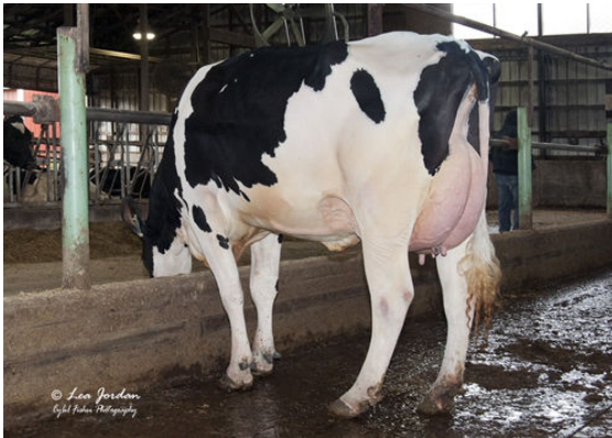
OCD BURLEY FRANCES 41330 FOURTH DAM