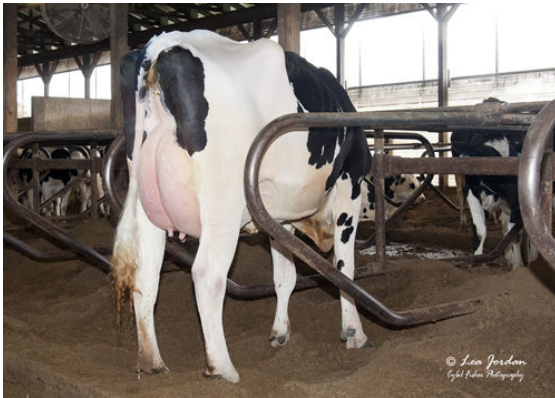
OCD BURLEY FRANCES 41330 FOURTH DAM