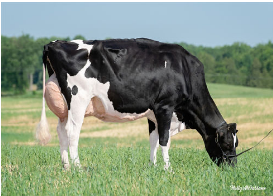
DULET D-LAMBDA KATRINA GRANDDAM