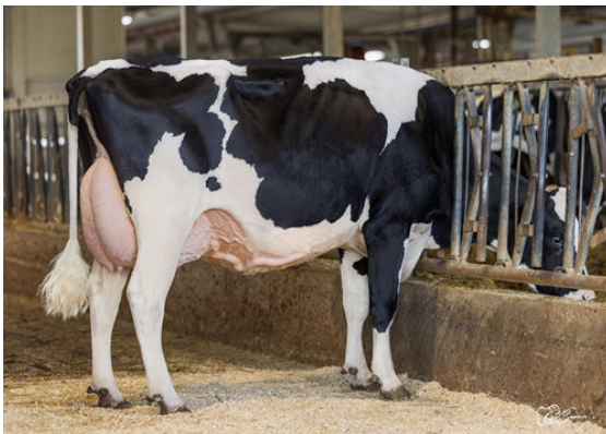
DREWHOLME CONWAY LEYSURE GRANDDAM