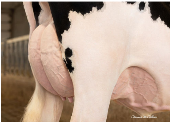
PROGENESIS ALLGAUD LATIFAH P DAM