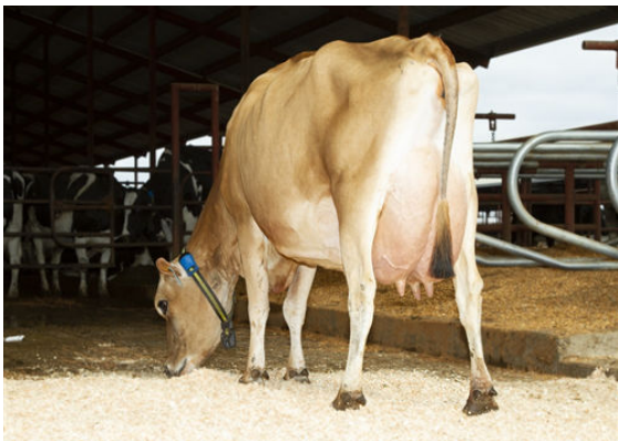
JX OAK LANE EUSEBIO ERICA {5} FOURTH DAM