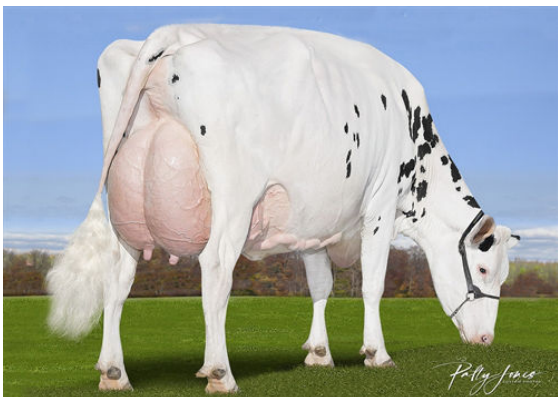
CALBRETT KINGBOY MIRANDA P THIRD DAM