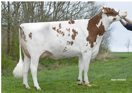
LAKESIDE UPS RED RANGE THIRD DAM