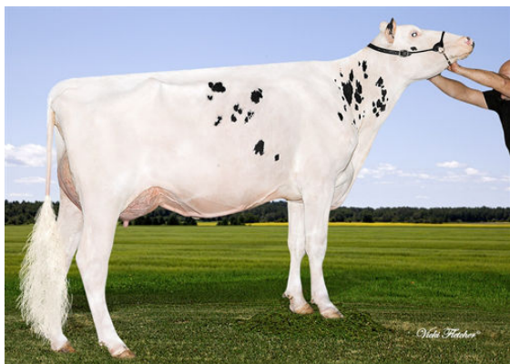
SILVERRIDGE V MOGUL EVON DAM