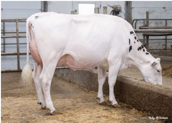
ALTONA LEA ALCOVE JERICHO DAUGHTER