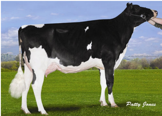
MS LOOKOUT PESC BKM BRIA FOURTH DAM