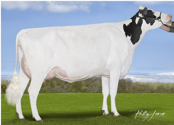
RI-VAL-RE BNDS SUNRISE DAM