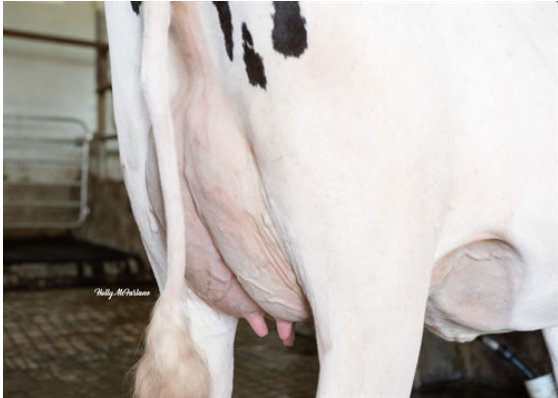
FB LULU ACHV VEGAS DAM