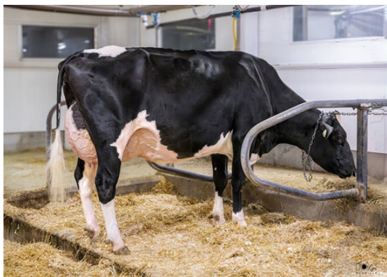
DUBENOIT MONTEVERDI EVELY DAUGHTER

PEAK ZAZZLE PROGENESIS POSITIV MILESTONE PROGENESIS POSITIVE PROGENESIS MAGNUS MIDLAND WET TUFFENUFF MAGNUS PEAK BOMBERO MAXIMA VG-87-6YR-USA DOM