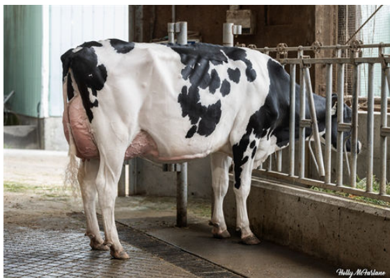
WESTCOAST MNTVRDI ABYSS 14595 DAUGHTER