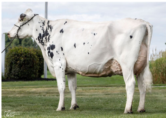
CLEAR-ECHO MONTVRDI 5621 DAUGHTER