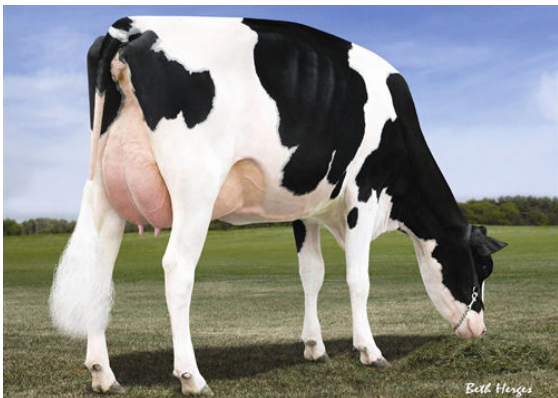
MORSAN MAN D MISSY FIFTH DAM