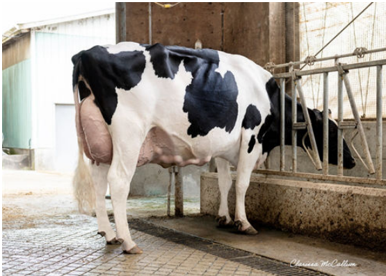
PROGENESIS GAMEDAY TITANIA DAM