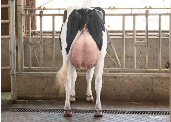
PROGENESIS GAMEDAY TITANIA GRANDDAM