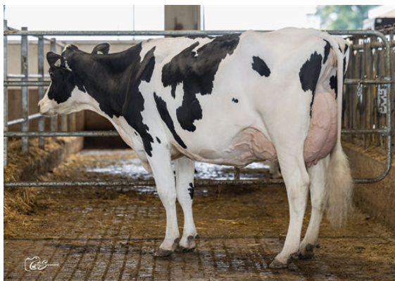
VAL-BISSON RANGER MUSIQUE GRANDDAM