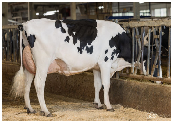
VAL-BISSON RANGER MUSIQUE GRANDDAM