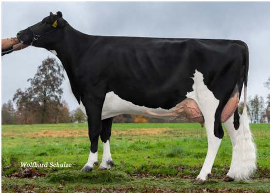
MAR LADY LENA GRANDDAM