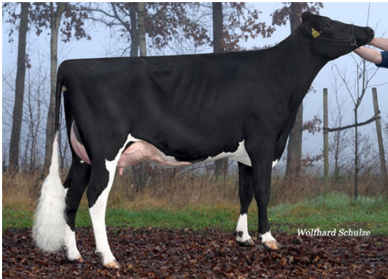
WKM LADYLIZ MR THIRD DAM