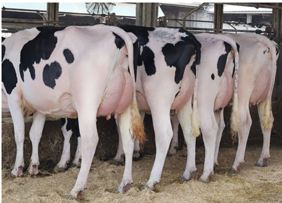
ROZTAC DAUGHTER GROUP L TO R - OLZA ROZTAC 2297, 2326, 2331, 238