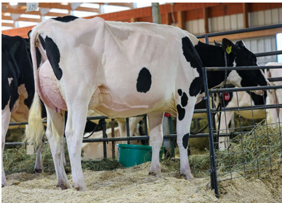
LUNCREST ROZTAC MELLO-2802 DAUGHTER