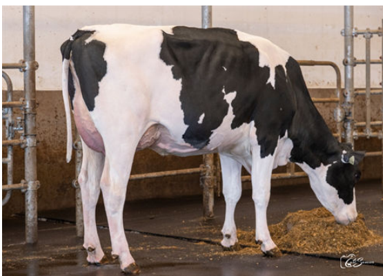
NORCA ROZTAC APPLECREAM DAUGHTER