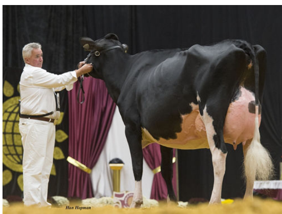
COMESTAR LAMADONA DOORMAN GRANDDAM