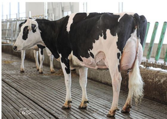
COMESTAR LAMAGIC IMPRESSION DAM