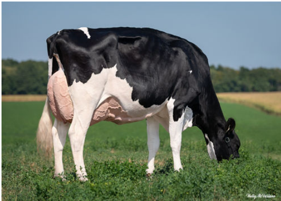
PROGENESIS HIGHJUMP LEADER GRANDDAM