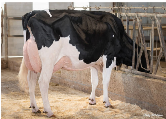
PROGENESIS HIGHJUMP LEADER GRANDDAM