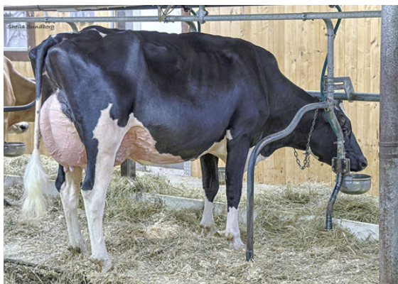
DULET PERFECT KELLY DAM