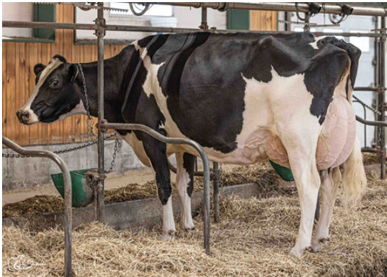
JACOBS LAMBDA BRIAR GRANDDAM