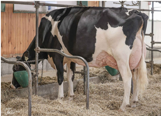
JACOBS LAMBDA BRIAR GRANDDAM