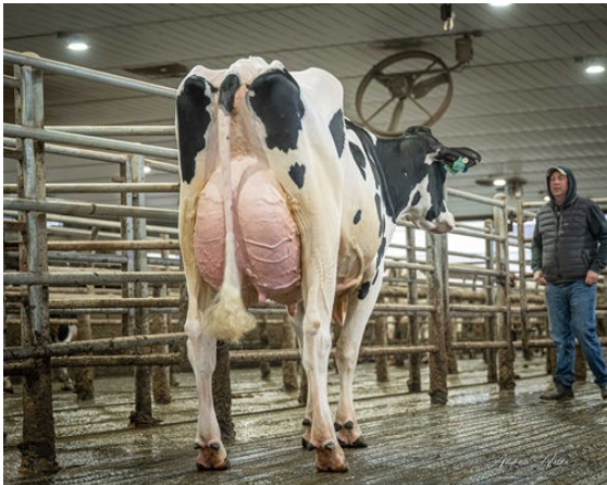
OCD WHEELHOUSE RAE 68559 DAM