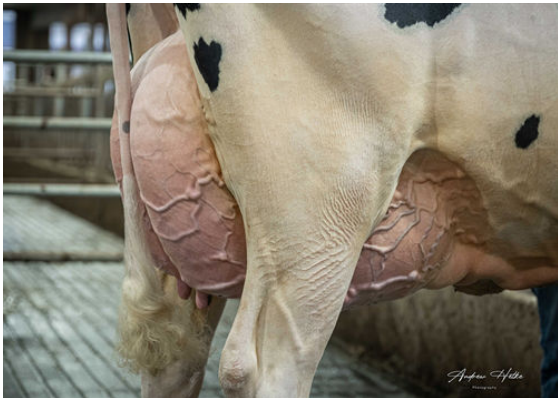
OCD WHEELHOUSE RAE 68559 DAM