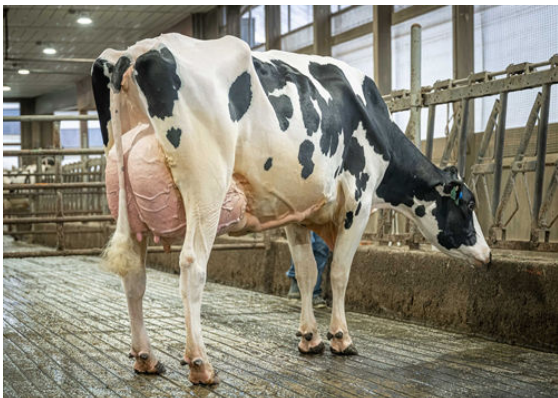
OCD WHEELHOUSE RAE 68559 DAM