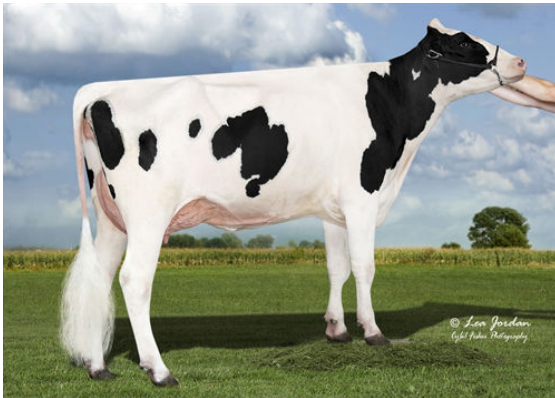
SCENERY-VIEW CRYSTAL FIFTH DAM