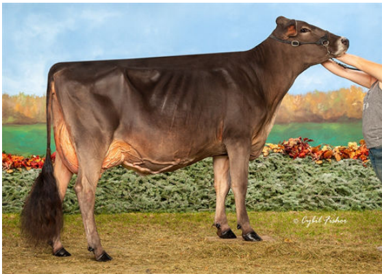
PIT-CREW RICH PEACHES TWIN DAM