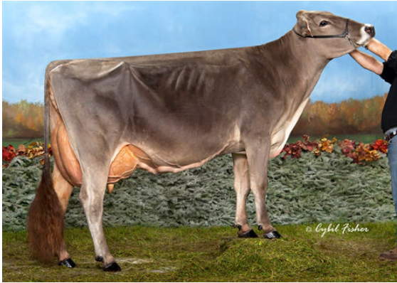
PIT-CREW WONDER PIPER GRANDDAM