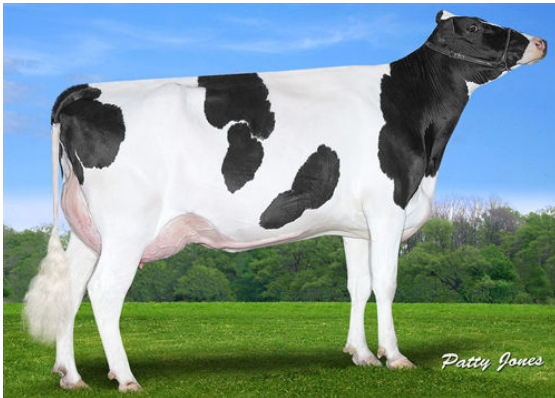
CLAYNOOK FIESTA MODESTY DAM